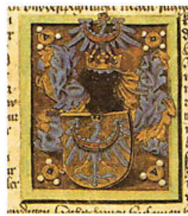
Grb dežele Kranjske, 1463