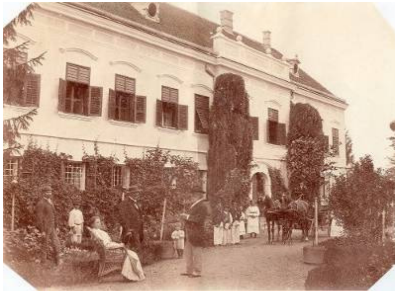
Graščinski dvorec Jurovo pred letom 1910