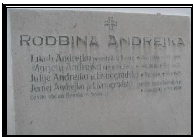
Plošča na grobnici rodovine Andrejka v vasi Rova