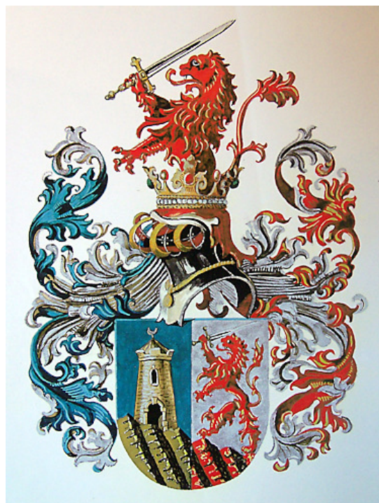
Grb pl. Livnograd (Vir: Mariano Rugale, Reprodukcija grba ni dovoljena)